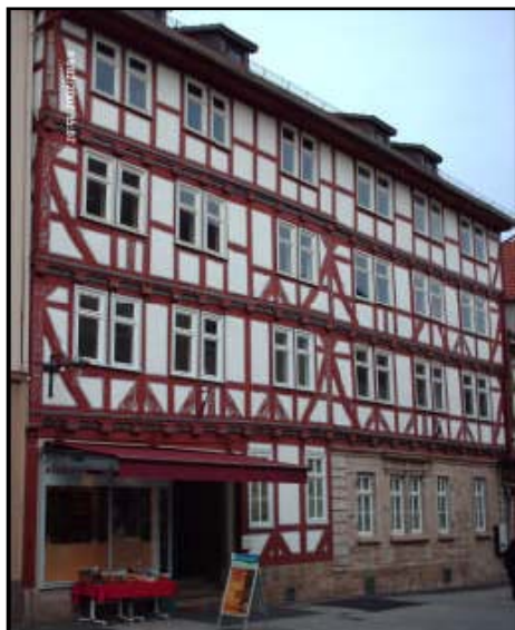
Oben: Gebäude am Obermarkt in Eschwege

Separat wurde die Erstellung des regionalen Entwicklungskonzepts im Rahmen des Stadtumbaus für die sieben Kommunen der Region Mittleres Werratal nachgeholt. Dies geschah in Form eines koordinierten Arbeitskreises bestehend aus den acht Bürgermeistern und Planern. Im Dezember 2006 wurden die ersten Ergebnisse vorgestellt. Mittlerweile erfolgte eine Zusammenführung der beiden Konzepte durch das beauftragte Stadtumbaumanagement. Auf dieser Grundlage stellten die beteiligten Kommunen 2008 als Kommunale Arbeitsgemeinschaft Mittleres Werratal einen Antrag auf Förderung.